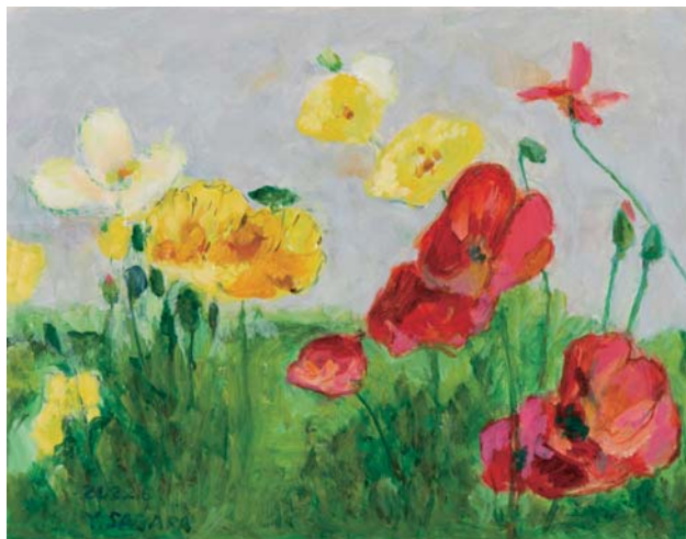
春 爛 漫

桜島は季節により時間により七変化する。夕刻には赤い又は紫色につつまれる時がある。今年の桜島展に出品。