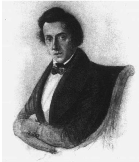
図46 婚約者マリア・ヴォジンスカの画いたショパンの肖像画 (1836) (音楽の手帖, ショパン, 青土社, 1980)