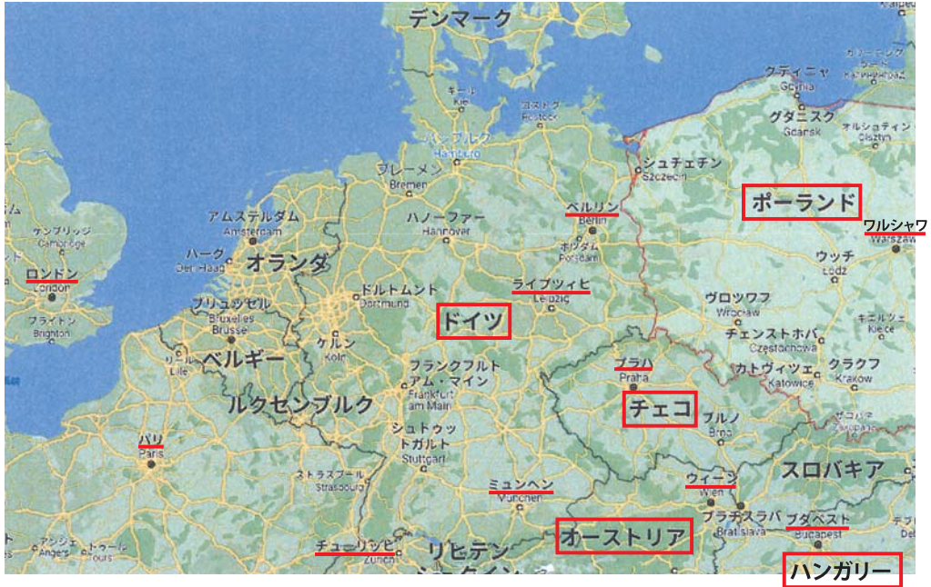
図39 現代のヨーロッパ地図

その右側と下段の青枠の部分が、リストのピアノ独奏曲全集 (R.ハワード) である。