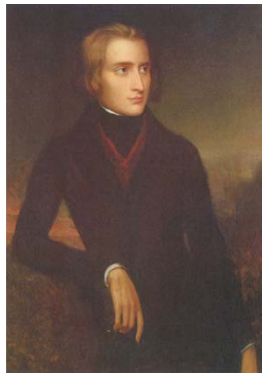
図40 リストの肖像画

図39は、現代のヨーロッパ地図である。各国や、大都市の位置関係を理解する為の一助として提示する。