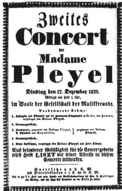
図45 ブレイエル夫人と共演するリスト プログラム5番は2人の「華麗なる二重奏」 (ブレイエル夫人の1839年の演奏会プログラム)

ブレイエル夫人とは、ベルリオーズとの婚約を破棄し、さっさとピアノ製作者ブレイエルと結婚した、女流ピアニスト、マリー・