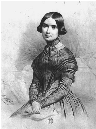
図44 女流ピアニスト、マリー・モーク＝ブレイエル (西洋音楽史大系5, K.K.学習研究社, 1998)