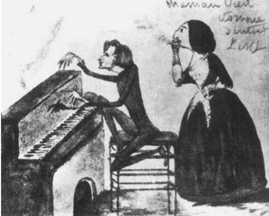
図41 ノーアンの館でピアノを弾くリスト ジョルジュの息子、モーリスの画 (Ca. 1837) (C. Suttoni: F. Liszt. The Univ. of Chicago Press, 1989)