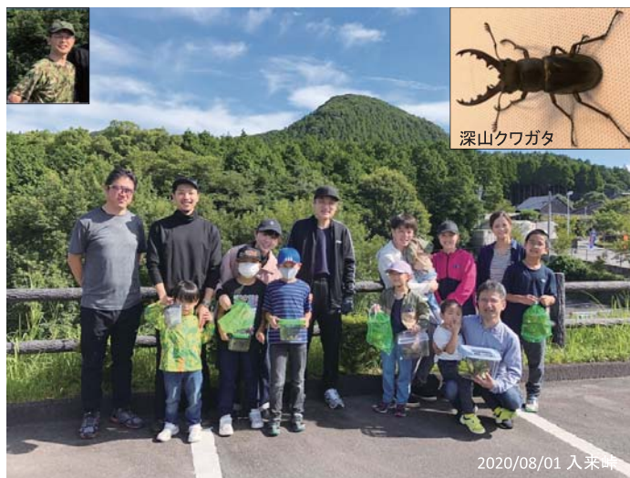
図2 入来峠での一コマ

30年以上鹿児島を外から見てきて、鹿児島には豊かな自然と文化があり、人材育成に適した場所であることを強く感じていた。臨床、研究、教育の環境と論理的な側面の指導体制を私たちが整えるとして、若者には私たちが教えることができない情緒と感性をこの地の利を生かして十分に身に付けていてもらい、次の世代に伝えていてもらいたいと願っている。