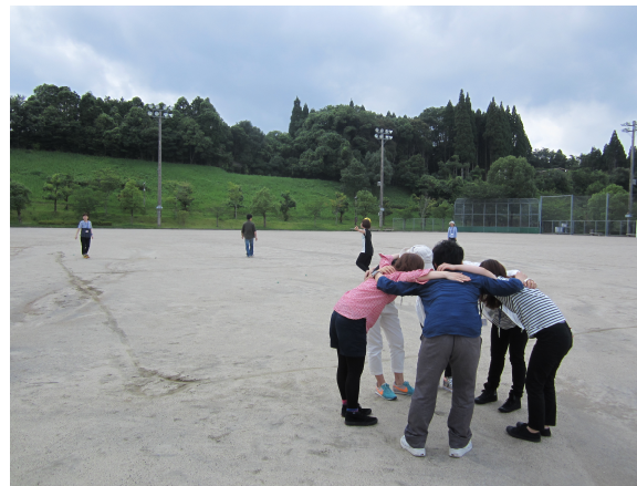
リフレッシュ研修（1泊）