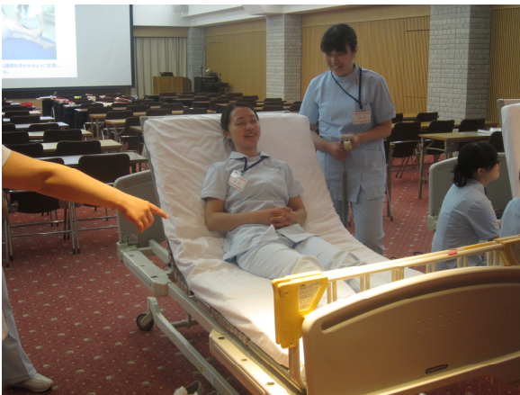
創傷管理技術（ずれ体験）