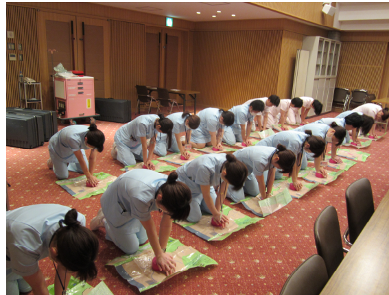
救命救急処置技術