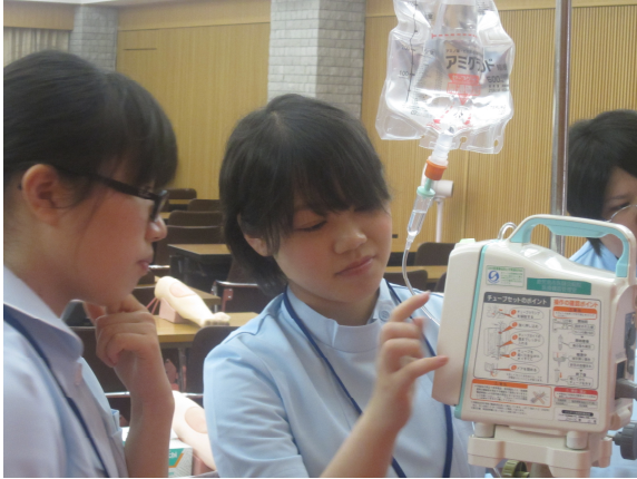
輸液ポンプの操作