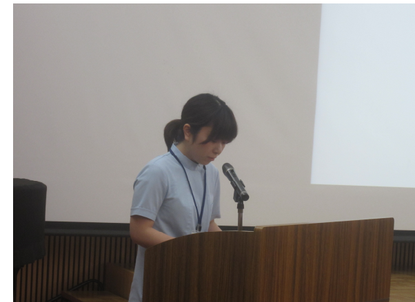
ナラティブ発表会