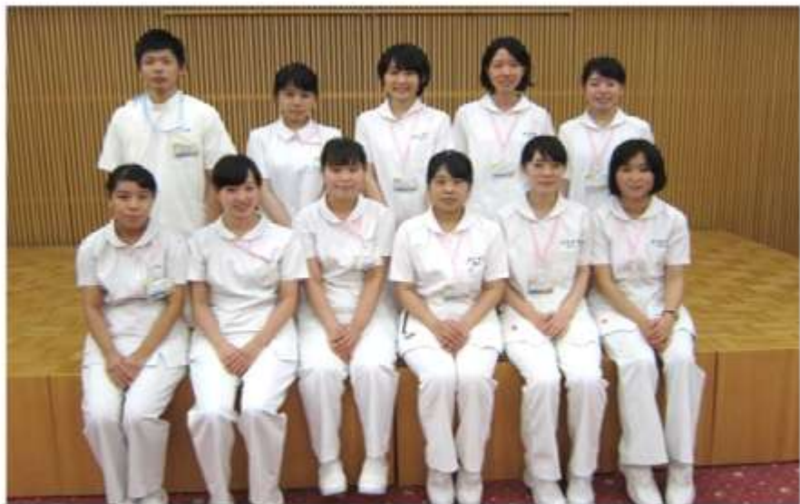
3校11名の看護学生さんが参加しました