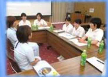
先輩看護師との話らい