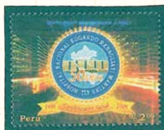
国立病院50年 同国地図をモチーフにした 記念ロゴ, 背景に夜景 ペルー(2008年)