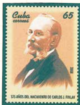
科学者フィンレー誕生175年 医師で科学者 カルロス・フィンレー(1833～1915)の肖像 キューバ(2008年)