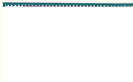
戯れる男児(児童の死亡率の減少)