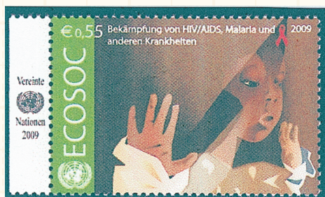
少女とレッドリボン (HIV/AIDS, マラリア等の疾病の予防)