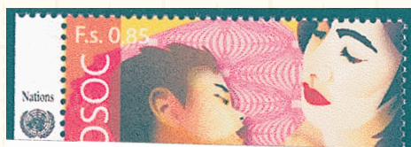
幼児を抱く母(母子健康の改善)