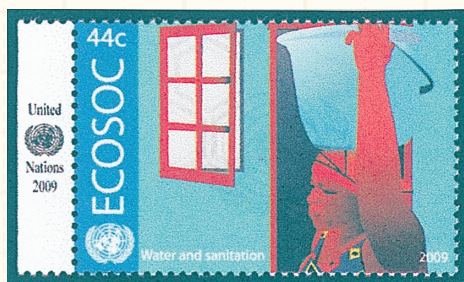
水を運ぶ女性(水と衛生)